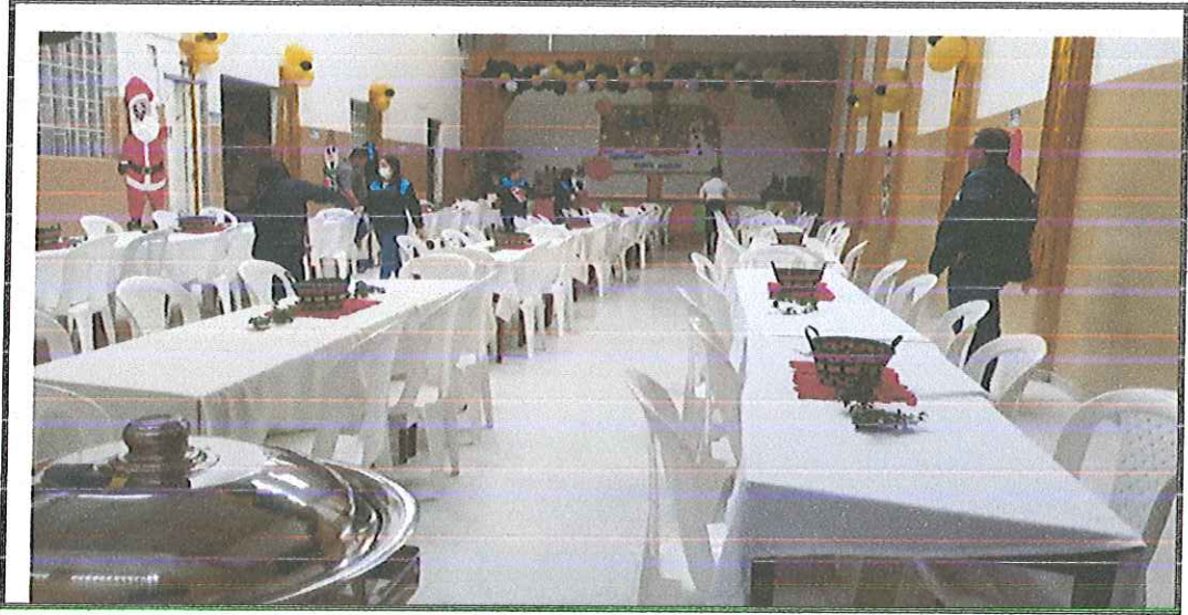
Imagen 3 Entrega de bonificación